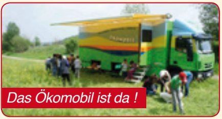
Das Ökomobil ist da !

Kindersachen-Flohmarkt, Kinderschminken, Mobiler Barfuß-Pfad, Batiken, Wettnageln, Gestalten von Grasköpfen, Gestalten mit Salzteig, Basteln mit Naturmaterialien Puppenspiel (14:30 Uhr und 15:30 Uhr im Pfarrzentrum) Die Naturpark-Kochschule lädt kleine Feinschmecker und Neugierige zum gemeinsamen Kochen und Entdecken ein