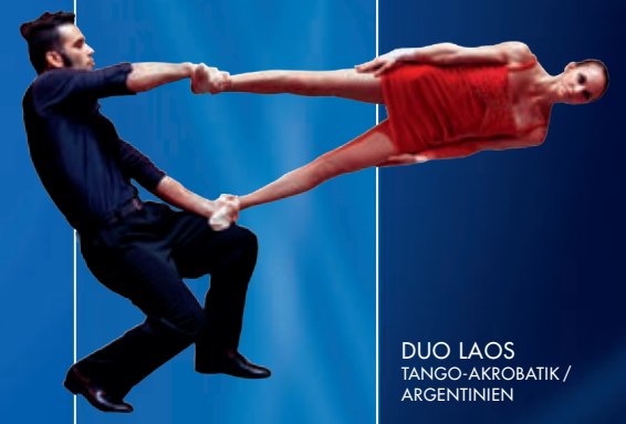
DUO LAOS TANGO-AKROBATIK / ARGENTINIEN