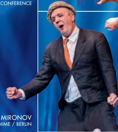
ALEXEY MIRONOV COMEDY MIME / BERLIN