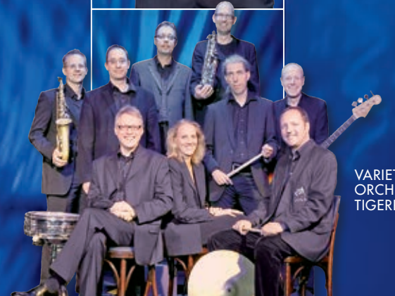
VARIÉTÉ ORCHESTER TIGERPALAST