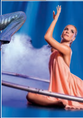
VALÉRIE-INERTIE BALLET-AKROBATIK IM GROSSEN RING / KANADA