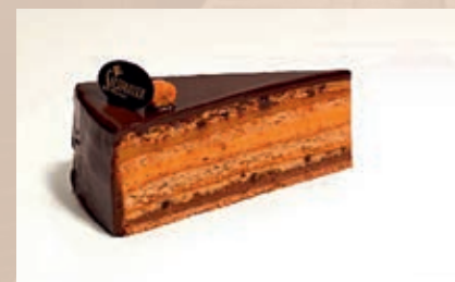
■ Siesmayer Torte