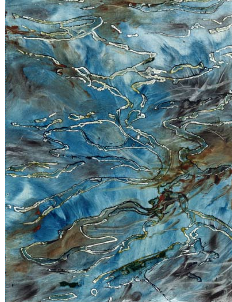
Herr Zinens wandelnde Welt, 2012, Absprengtechnik, Wvz.nr. 522