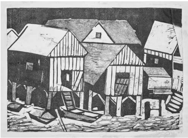
Bodmann, 1959, Linolschnitt, Wvz.nr. Lin 6