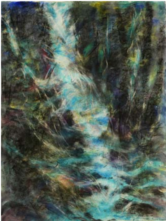
Gebirgswasser, 2008, Aquarell und Kreide, Wvz.nr. Z 693