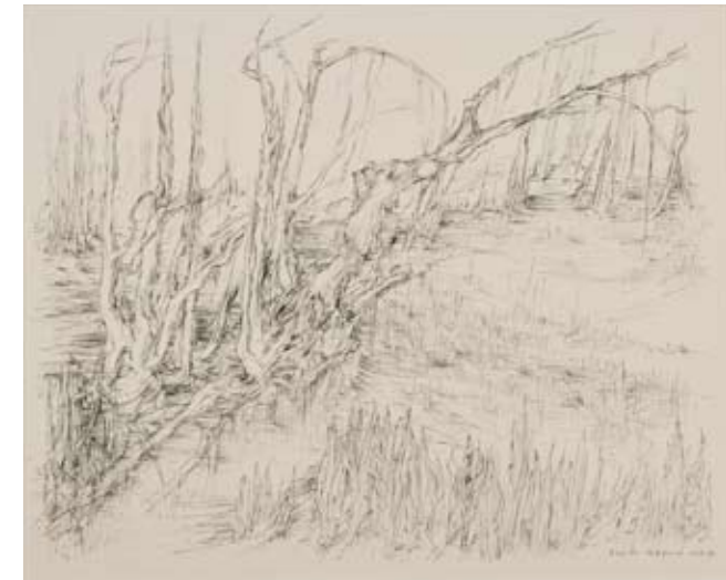
Im Auwald, 1995, Tuschkfeder, Wvz.nr. Z 496