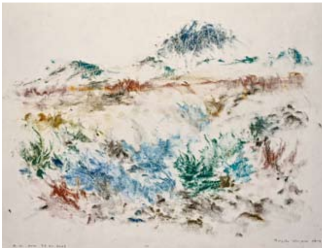
Nordisches Blüten I, 2013, Monotypie, Wvz.nr. Mono 3