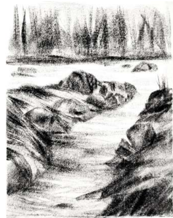
Steinige Bucht, 1985, schwarze Kreide, Wvz.nr. Z 313